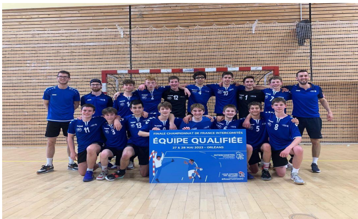
Comité 14 génération 2009 vainqueur du tour Inter-régional à Bourges

Le tour Inter-régional du week-end de Pâques a permis à la sélection du Calvados de se qualifier pour les finales nationales à Orléans au mois de Mai 2023. A noter les bons résultats de la Seine-Maritime qui perd en finale d'un but et du regroupement de Comité de Normandie qui perd en 1/2 finale.