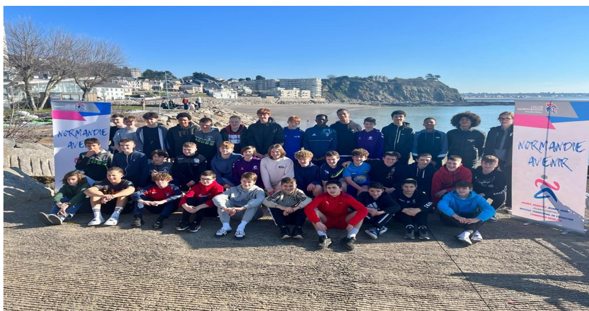
Granville février 2023

Les tours régionaux ont permis d'identifier les joueurs potentiels 2009 pouvant prétendre à l'entrée en Pôle pour l'année 2023/2024, mais aussi d'organiser l'édition 2023 du Normandie Avenir à Granville les 11-12 et 13 février 2023. 42 joueurs ont pris part à ce regroupement, à nouveau un moment d'évaluation des joueurs de la génération 2009.